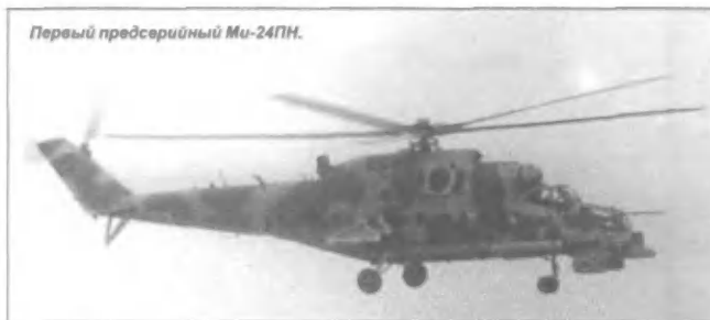
Первый предсерийный Ми-24ПН.